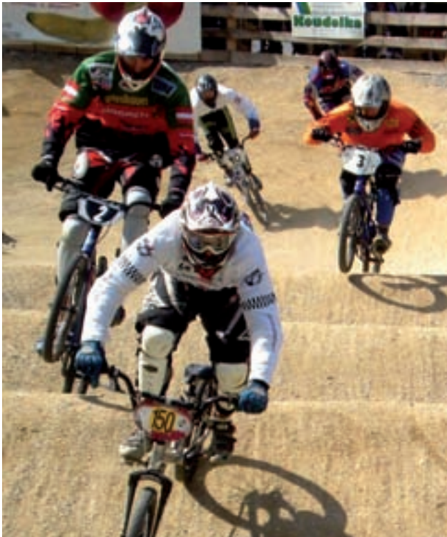
Das BMX-Racing-Team Vösendorf feiert Erfolge im In- und Ausland. Auch ein Weltmeister war schon dabei.